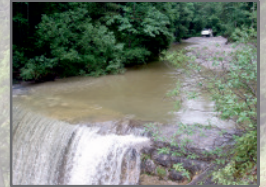
Geschieberückhaltesperre Große Laine, Gemeinde Jachenau