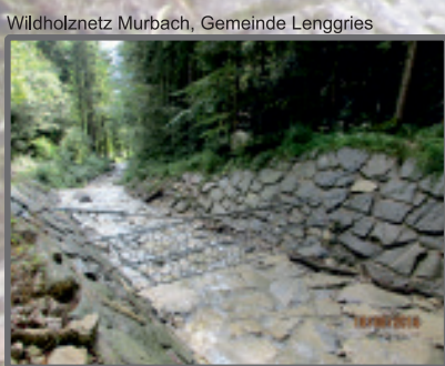
Wildholznetz Murbach, Gemeinde Lenggries