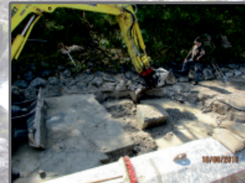
Schussgerinne Arzbach, Gemeinde Lenggries im Bau