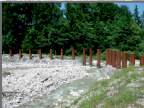
Wildholzrechen Arzbach, Gemeinde Lenggries