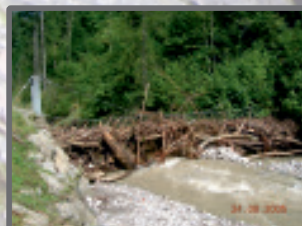
Wildholznetz Kanker, Markt Garmisch-Partenkirchen