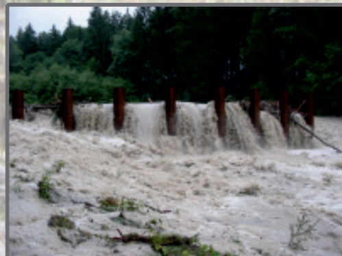
Während des Hochwassers 2005