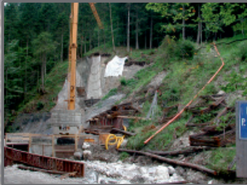
Murfang Arzbach, Gemeinde Lenggries im Bau