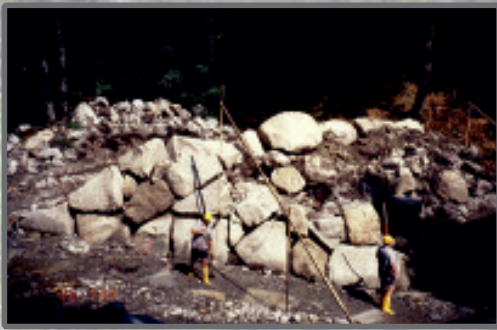
Murfang Deiningsbach, Gemeinde Walchensee im Bau