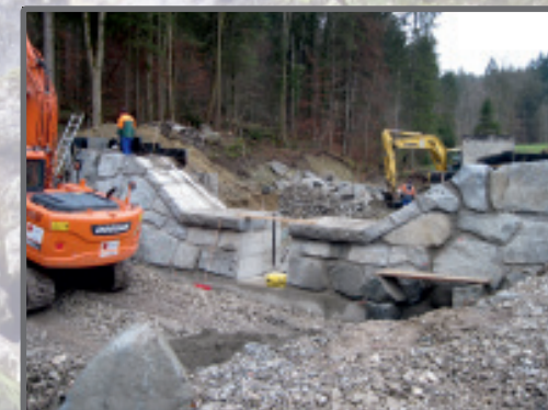
Geschiebedosiersperre Habichtgraben, Gemeinde Eurasburg