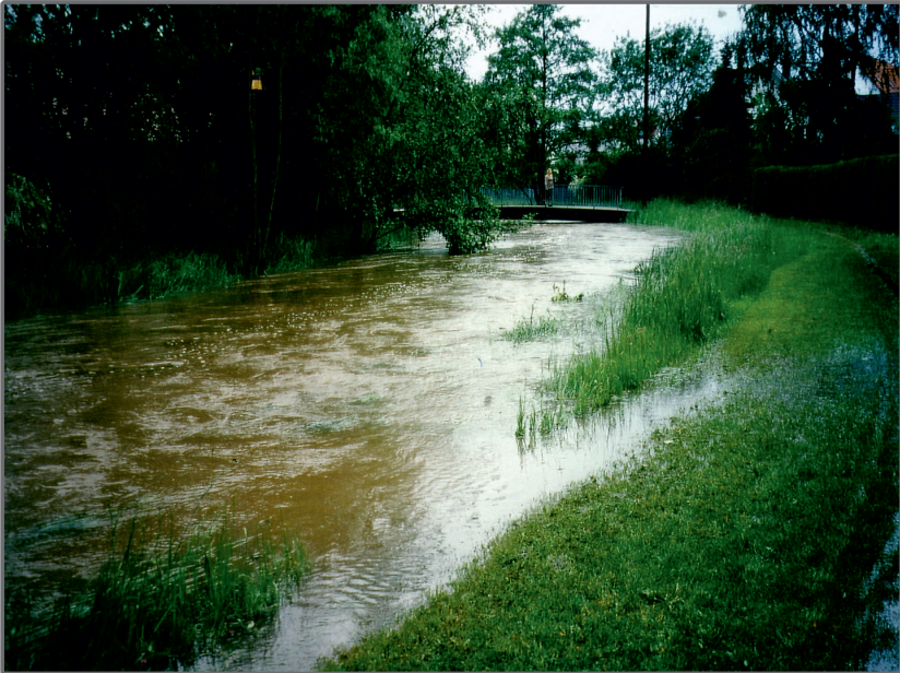
Verlorener Bach Pfingsthochwasser 1999