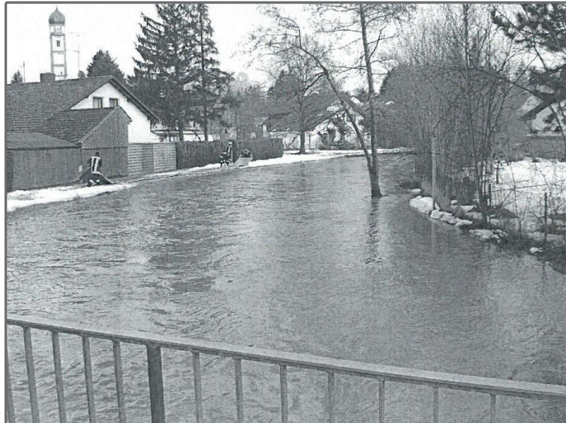
Verlorener Bach Schmelzhochwasser März 2006

Bei einem hundertjährlichen Hochwasserereignis (HQ100) am Verlorenen Bach kommt es derzeit zu großflächigen Überschwemmungen im Ortsbereich von Prittriching.