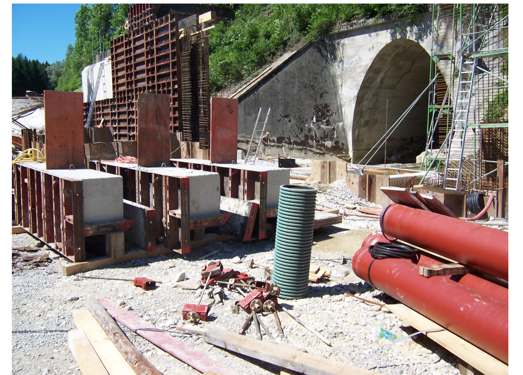
Durchlaufbauwerk im Juni 2005