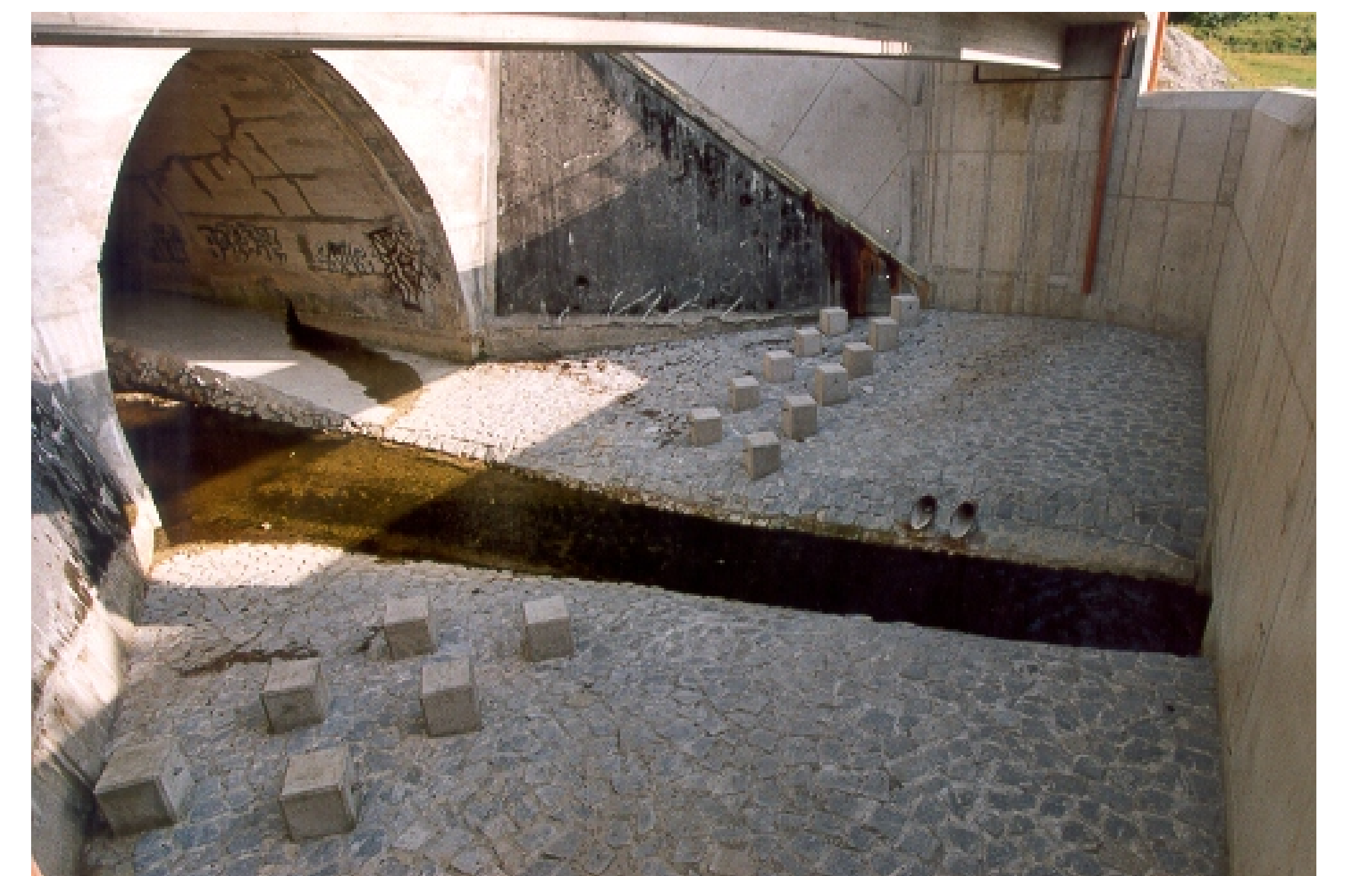
Fertiggestelltes Durchlaufbauwerk August 2006

Erste gelungene Bewährungsprobe beim Auguthochwasser 2005