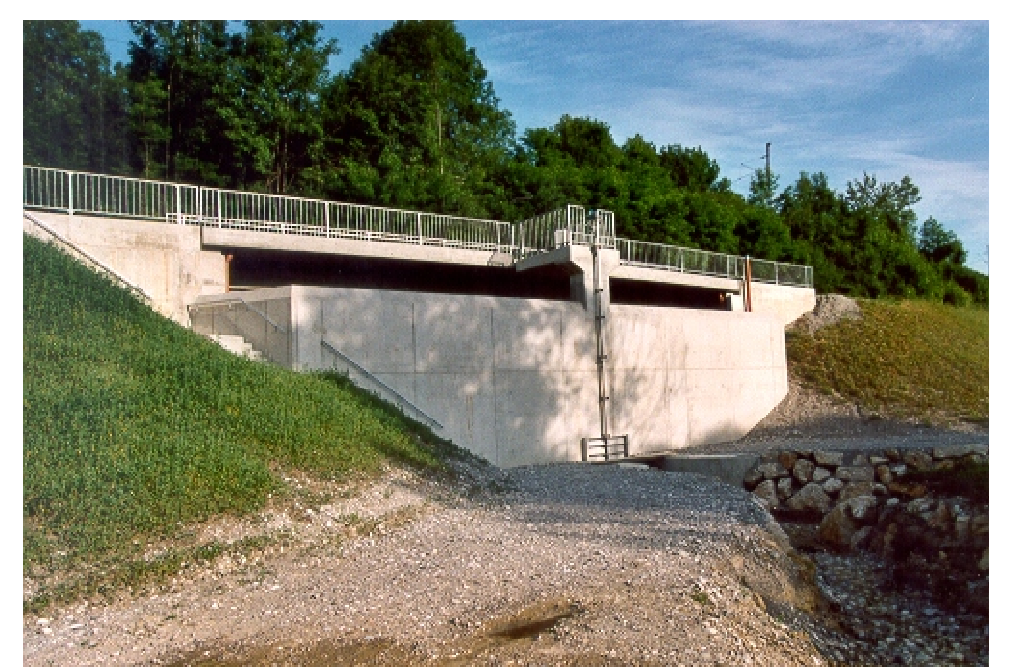
Fertigstellung im August 2006

Erste gelungene Bewährungsprobe beim Auguthochwasser 2005