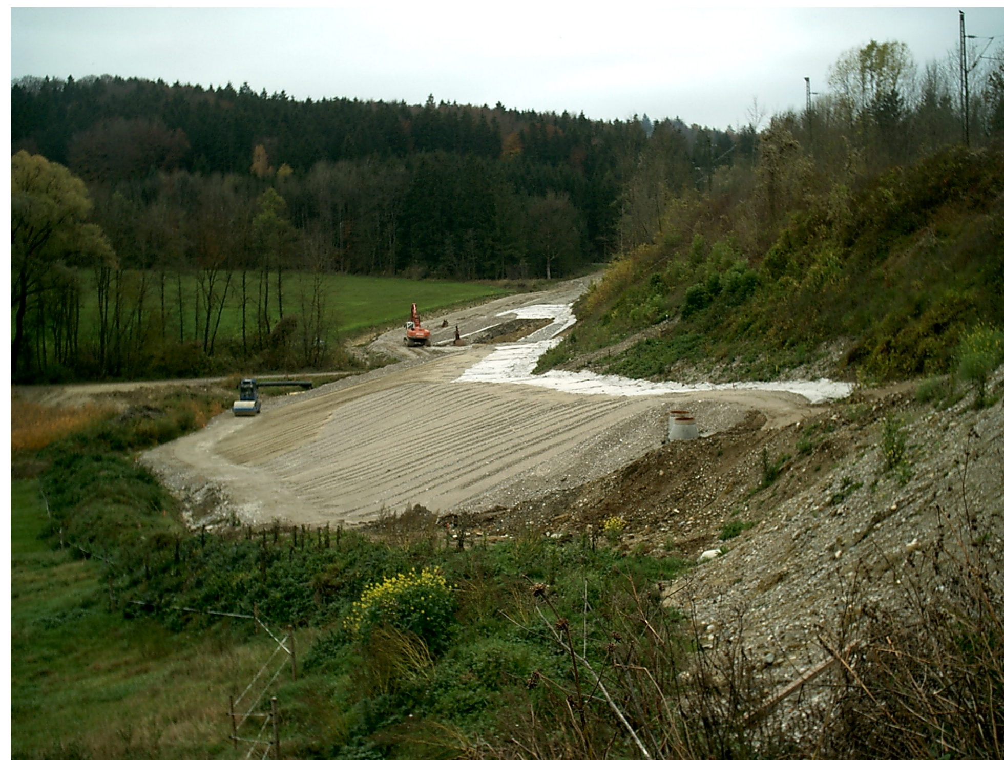
Baubeginn im Mai 2004