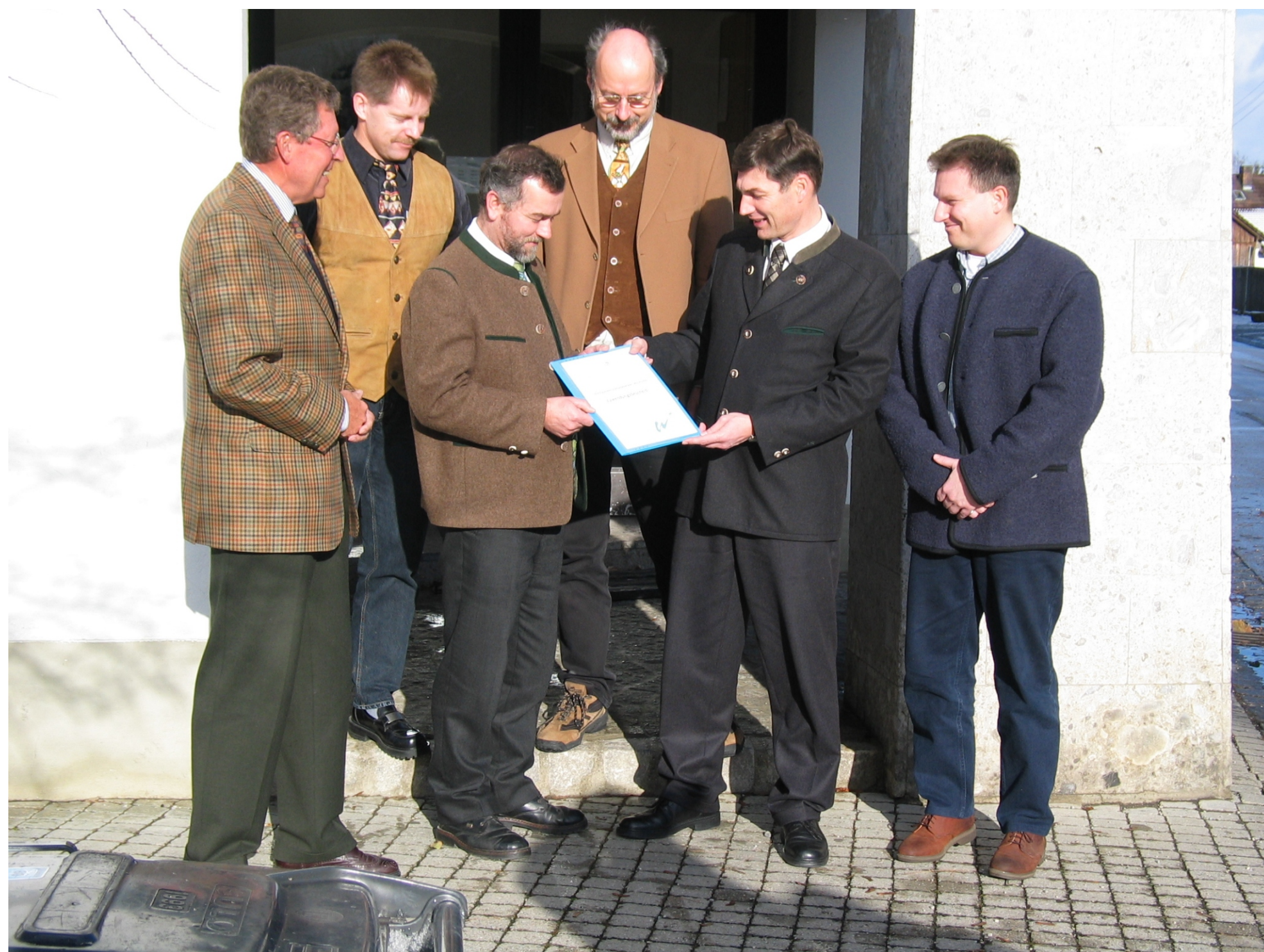
Bescheidübergabe am 15.12.2003