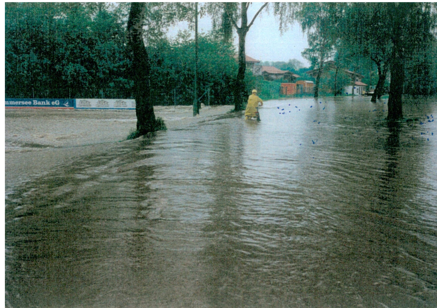
Pfingsthochwasser 1999, Stegener Strasse, Fussballplatz