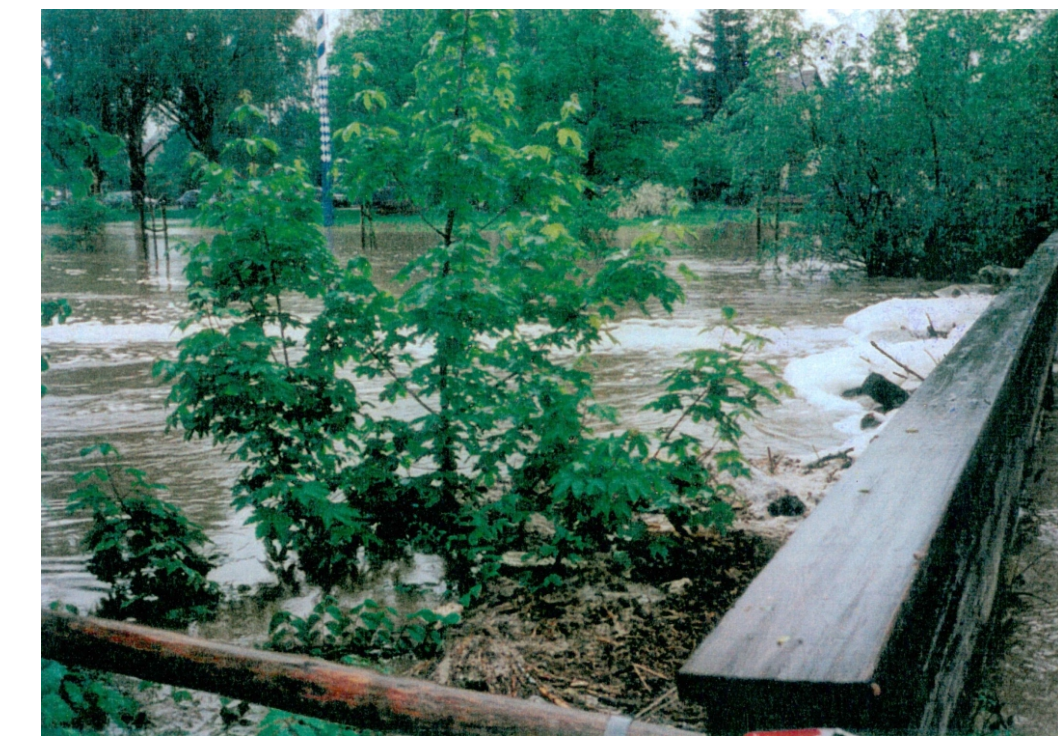
Pfingsthochwasser 1999, Verklausung am Fußgängersteg

In den Jahren 1999 und 2000 traten an der Windach in Eching am Ammersee im Bereich der Stegener Straße Überschwemmungen auf. Durch die geplanten Maßnahmen wird der Hochwasserschutz für diesen Bereich wesentlich verbessert.